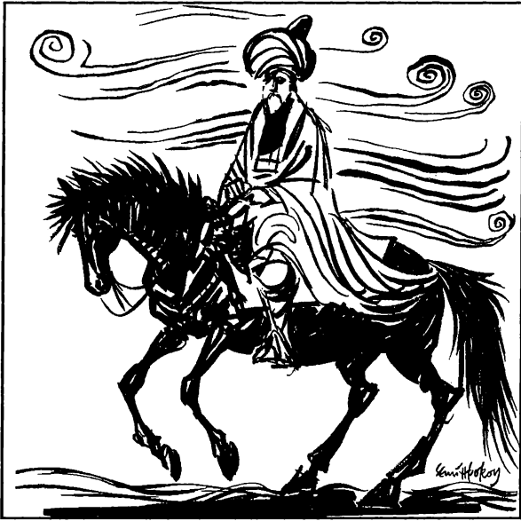
Resim 5. Çizim: Semih Poroy

Hakk, tapılacak varlıktır. Etkilendiği zaman kul olur. (...) Etkilenen mahluk birisi tarafından yaratılır, zorlanır, tutsaktır, kahredilmiştir. Demem o ki yaratan, zorlayan, tapındıran, kahreden yalnız Hakk'tır. Suretler onun oyuncaklarıdır. (13)