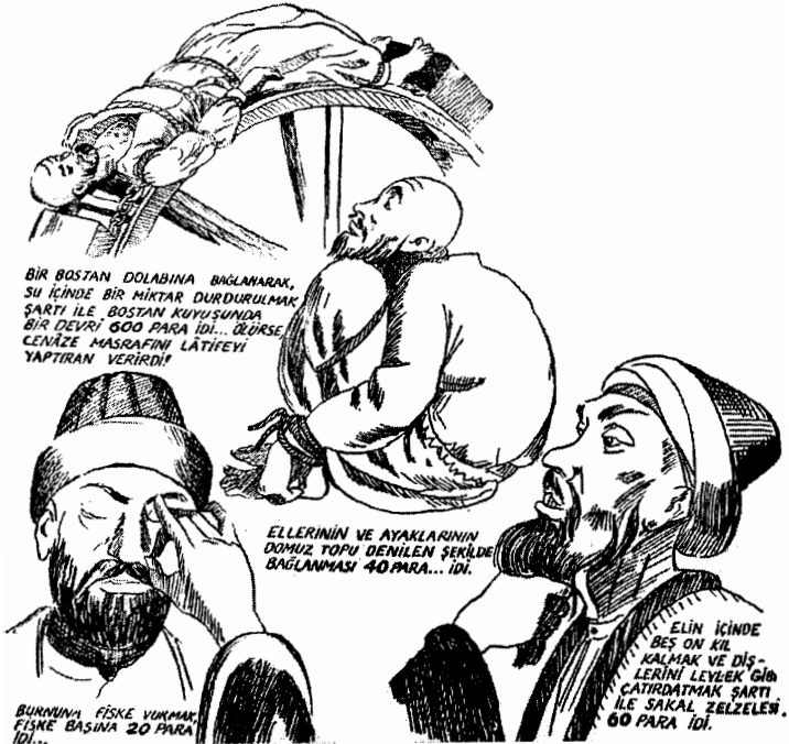
Resim 2. Dalkavuklar (11)