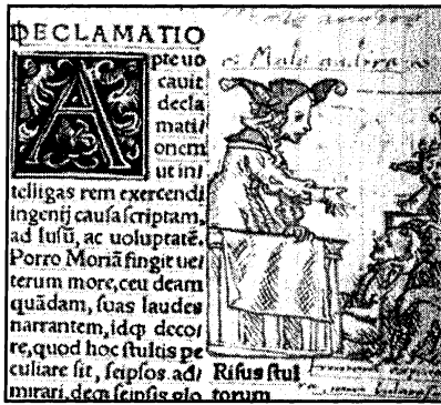
Resim 4. Hans Holbein - "Delilik söylev veriyor"

kültürel oluşum süreci, Rönesans'ı, dinde yenileşmeleri oluşturmuş, siyasallaşmış, burjuva devrimiyle de iktidara gelmişti.