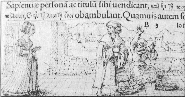
Resim 3. Hans Holbein - "Thomas Morus, güzel kadına bakarken yumurtacının sepetine basıyor"

Ankara ve Osmanlı Devletleri'ni kurmuş olan bu 13. yüzyıl Anadolu Türkmen hareketinin, Murad Hüdavendigâr (13) ile başla-