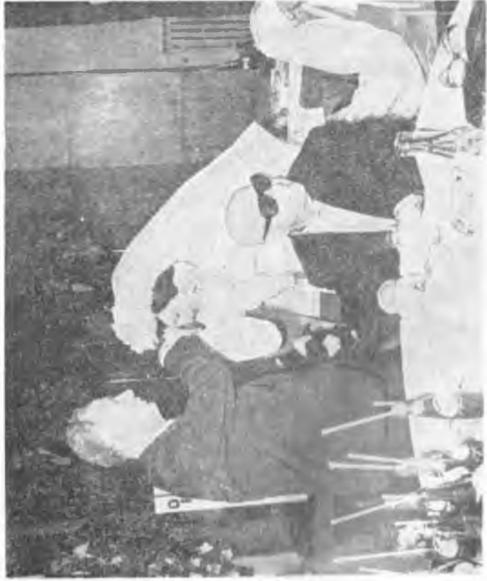
Son Düğün, Son Dilek : Şubat 1976