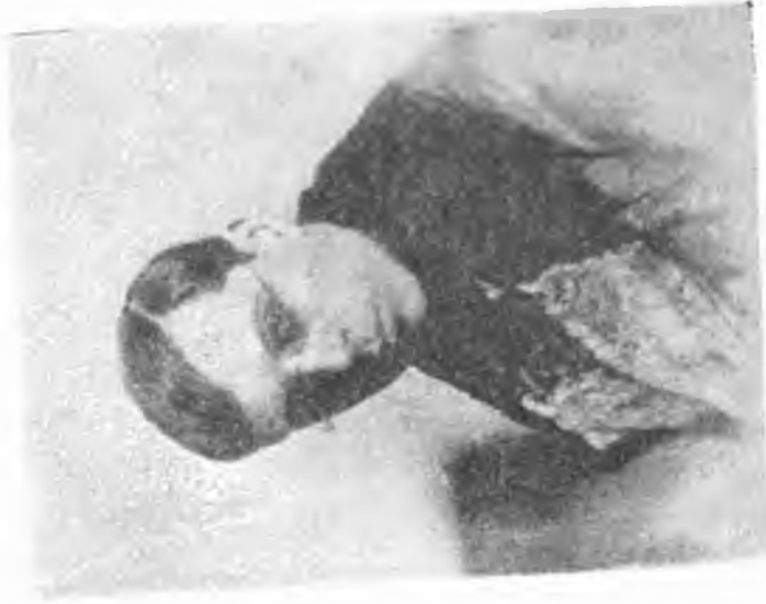
Universiteli Moskova'da : 1922