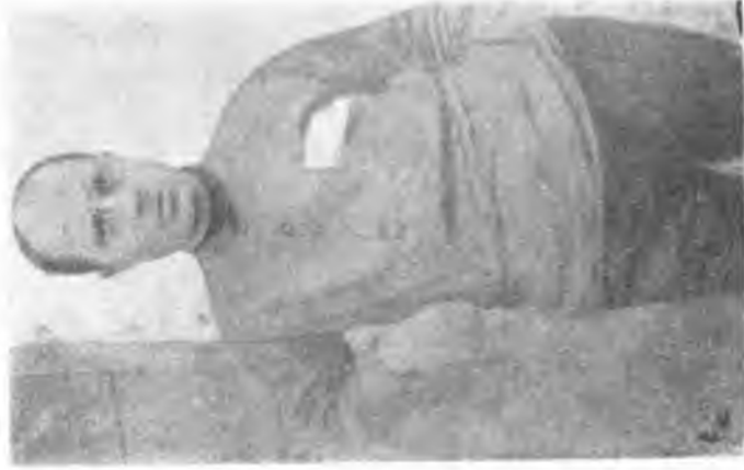
Afyon Cezaevinde 1926