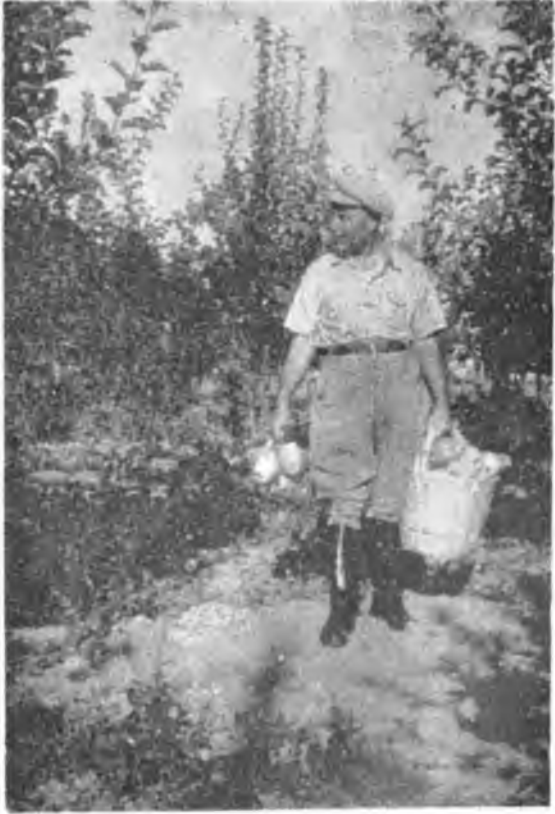
Toprađa Dönüş 1954