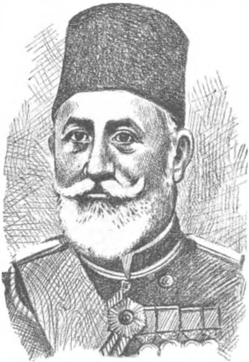
Hasan Rami Paşa