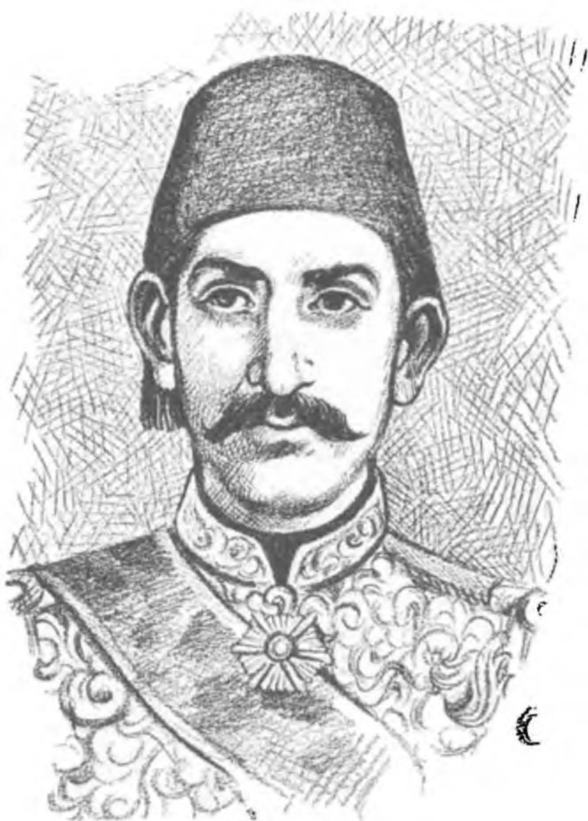
II. Abdülhamid (1876)