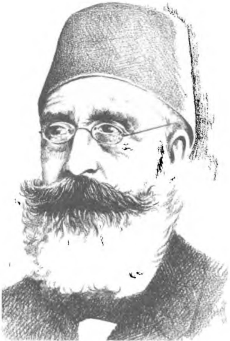
Misbat Paşa ( Büyük Devlet Adanı ve Büyük Şebis )