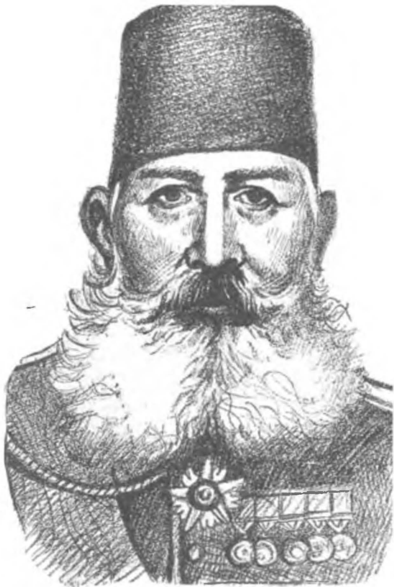
Serasker Rıza Paşa