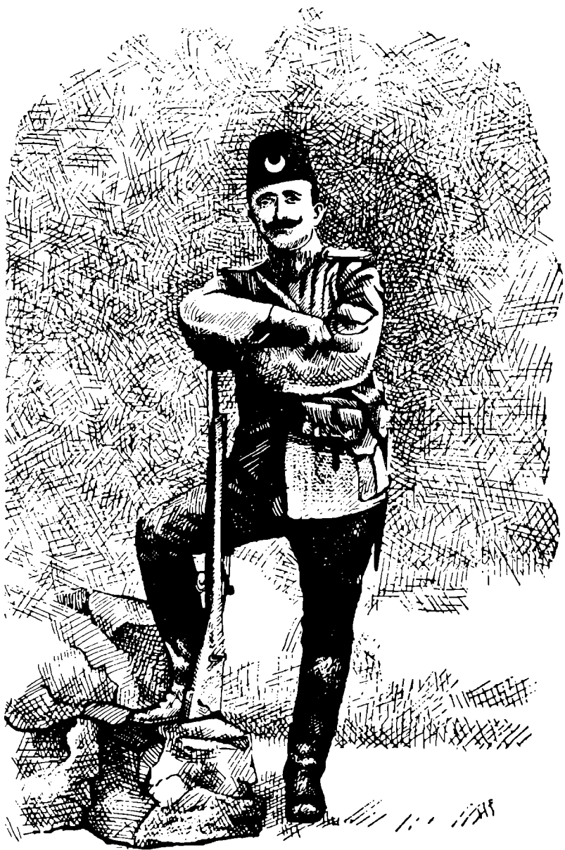
Enver Bey Makedonya'da çete savaşlarında..