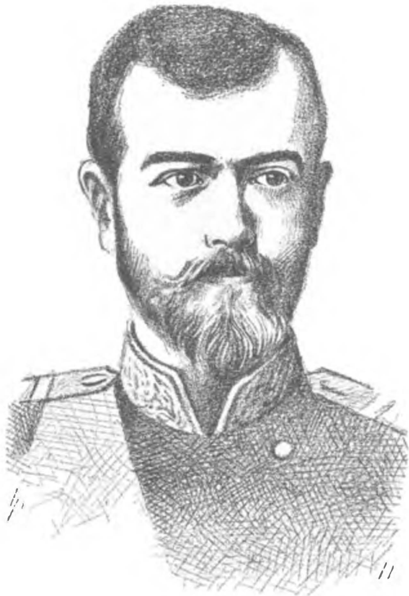
Rusya Çarı Nikola II.

(Reval mülakatında Çar Nikola I'in hayalini gerçekleştirmek istiyor!)