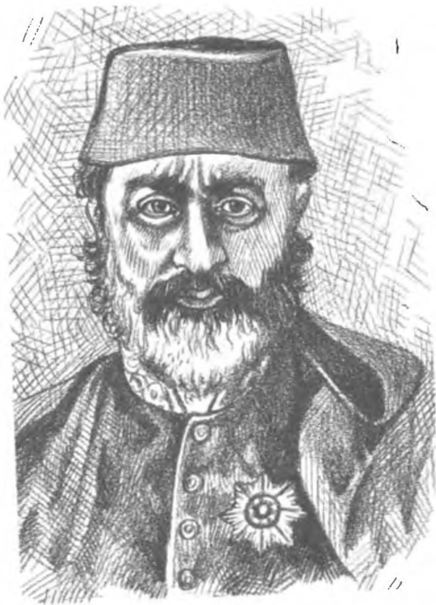
Sultan Aziz (1861-1876)