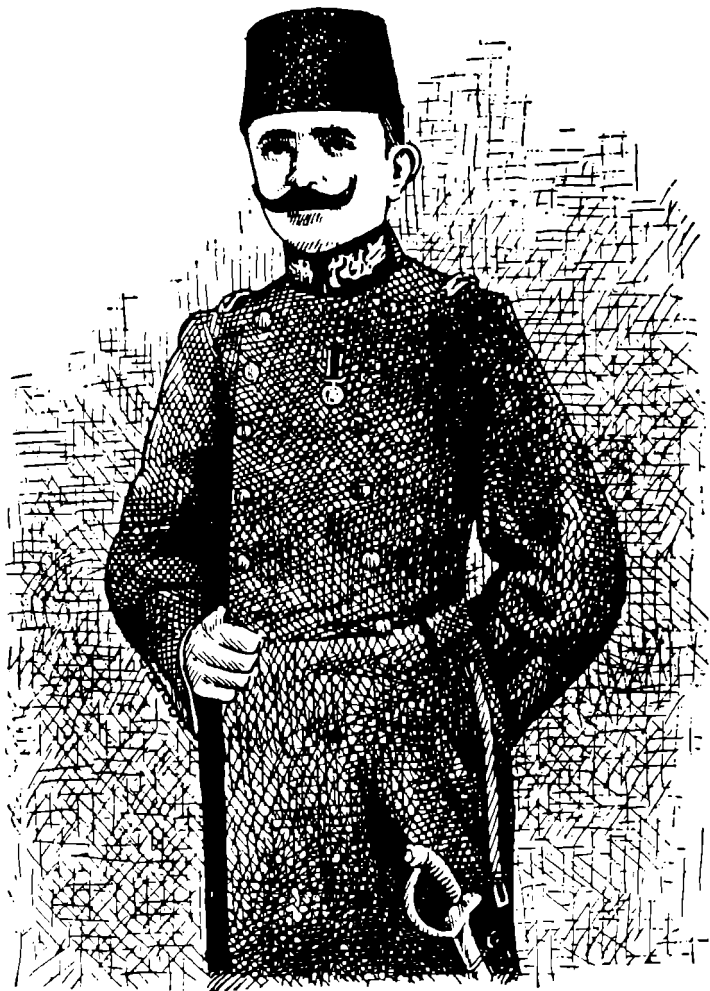
Binbaşı Enver Bey