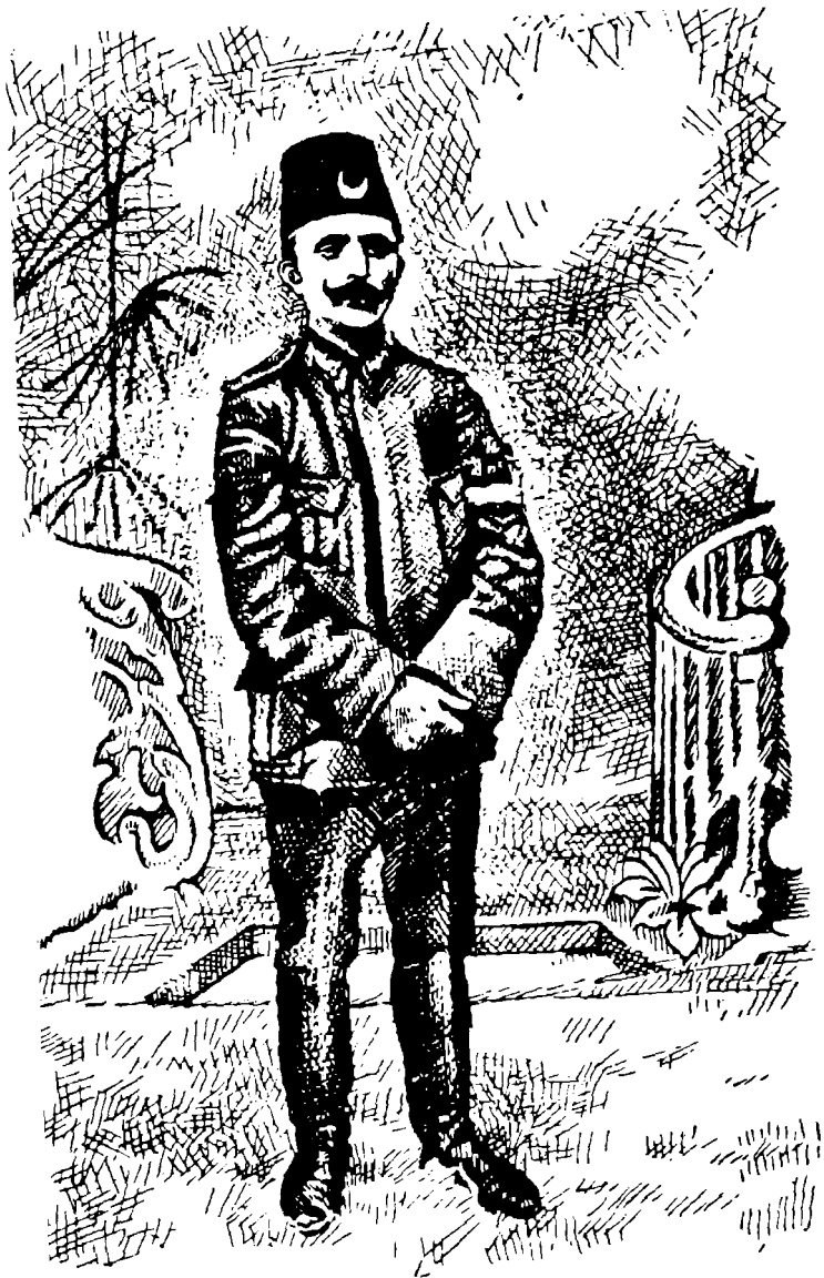
Enver Bey, hürriyetin ilân günlerinde!