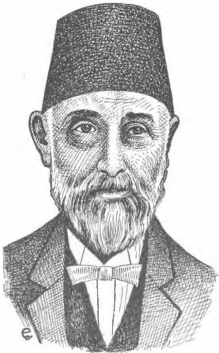
Sadrazam Tüfeyk Paşa