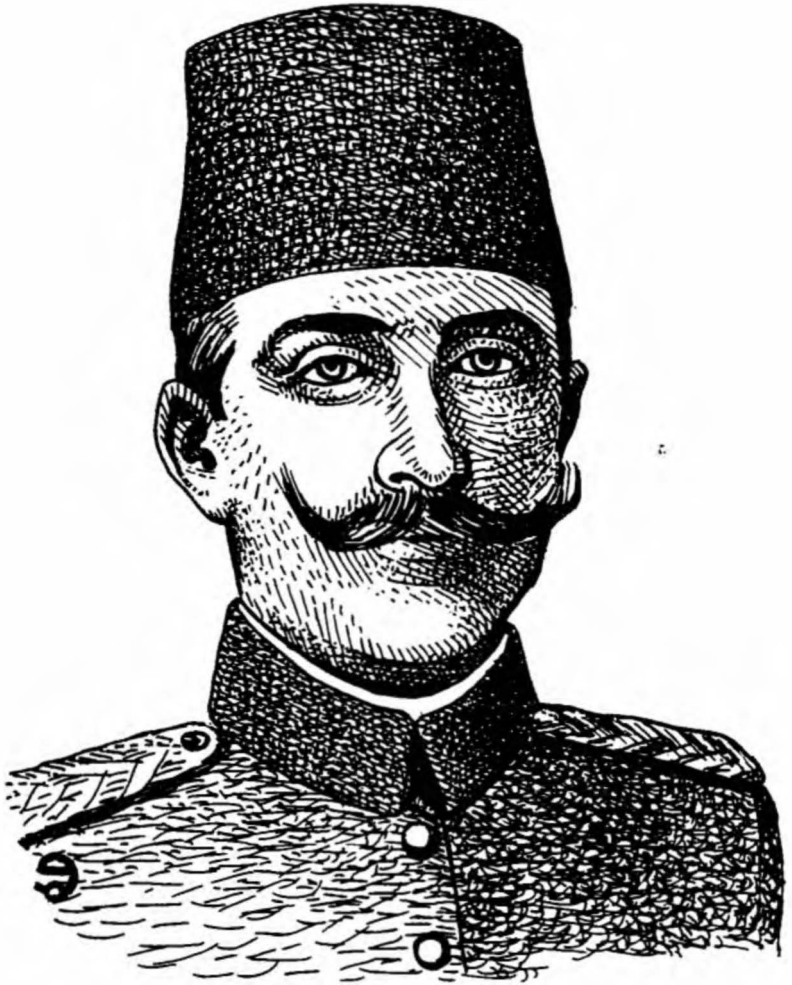
Cemal Bey (Paşa) İstanbul Muhafızı (Babıali baskınından sonra İstanbul'un kudretli adamı)