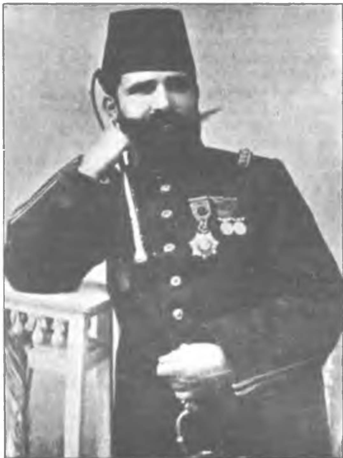
Hürriyet kabramanı Kolağası (Önyüzbaşı) Niyazi Bey