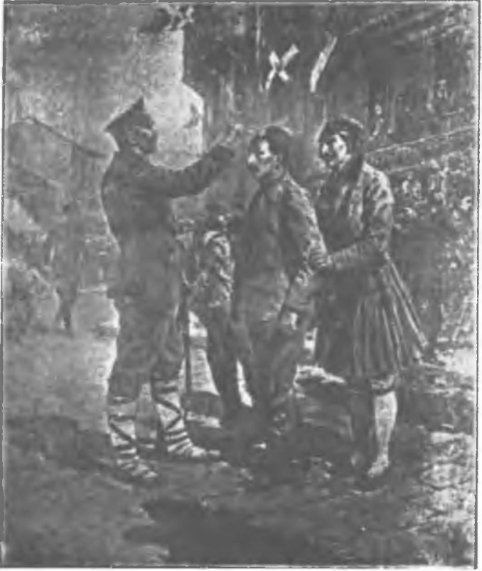
Bulgar ve Yunan askerleri yakaladıkları Osmanlı askerlerinin feslerine baş çizer ve zorla istavroz çkartırlardı.