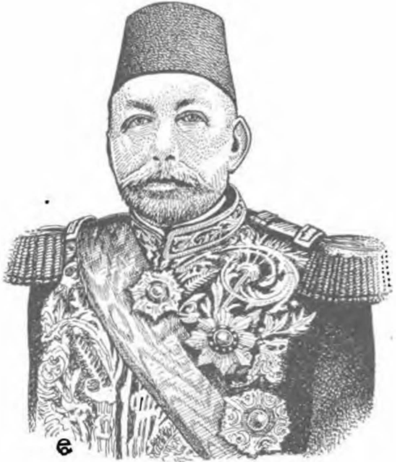
Beşinci Sultan Mehmet (Reşat) (1844—1918)