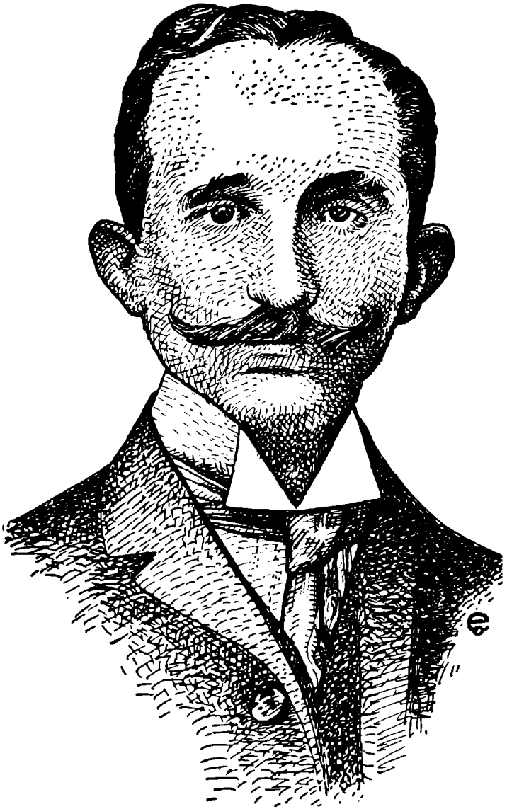
Öldürülen gazeteci Serbesti Gazetesi Başyazarı Hasan Fehmi Bey