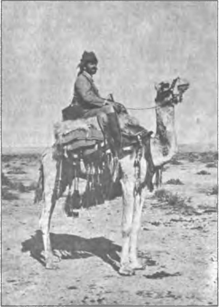
Çöllerdeki savaşı Binbaşı Emver Bey Kuzey Afrika'da (1911)