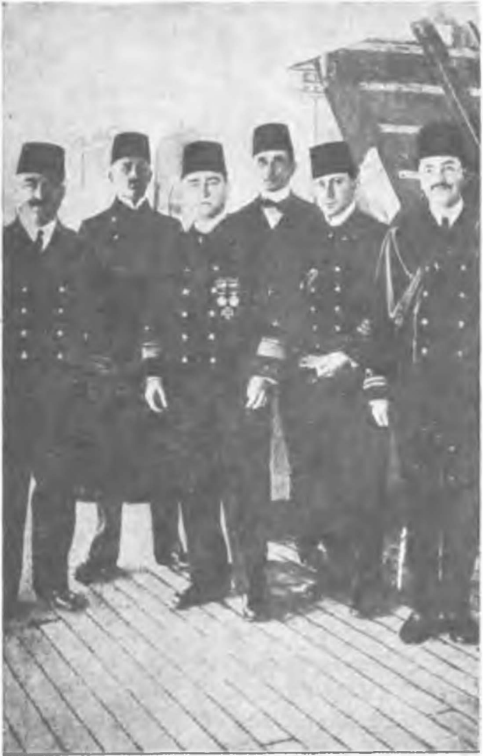
Alman Amirali Somchon ve maiyeti Osmanlı Donanması hizmetinde