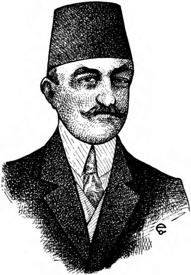
Rub hastası bir doktor: Rıza Nur Bey

Bütün ömrü, hem kendi kendisiyle, hem de çevresiyle çatışmakla geçti. Ruben hiç bir zaman sükûnunu ve dengesini bulamadı. Kendi hakkında yanlış değerlendirmeler, hayallerini hakikat sanmak illeti ve marazî benlik gururu, onu daima tedirgin etti. Hiç bir şeye, hiç bir zaman inonmadı. Tapışığı kendisiydi. Hayatında herkesi düşman gördü ama, aslında bir tek