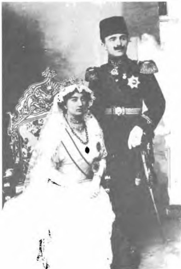
Enver Paşa ve Naciye Sultan evlendikleri günde