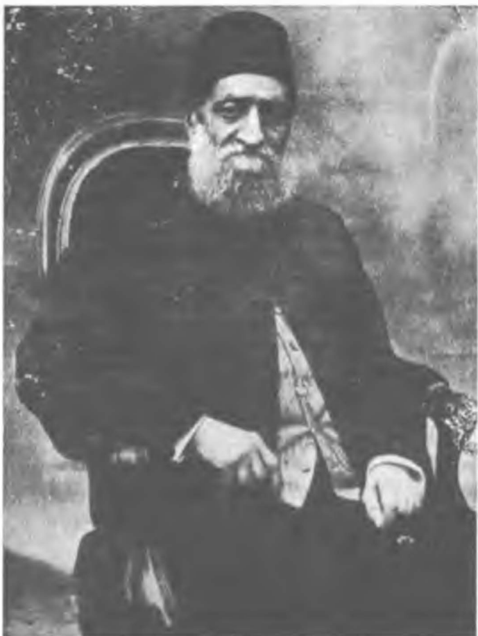
Kâmil Paşa (Sadrazam)