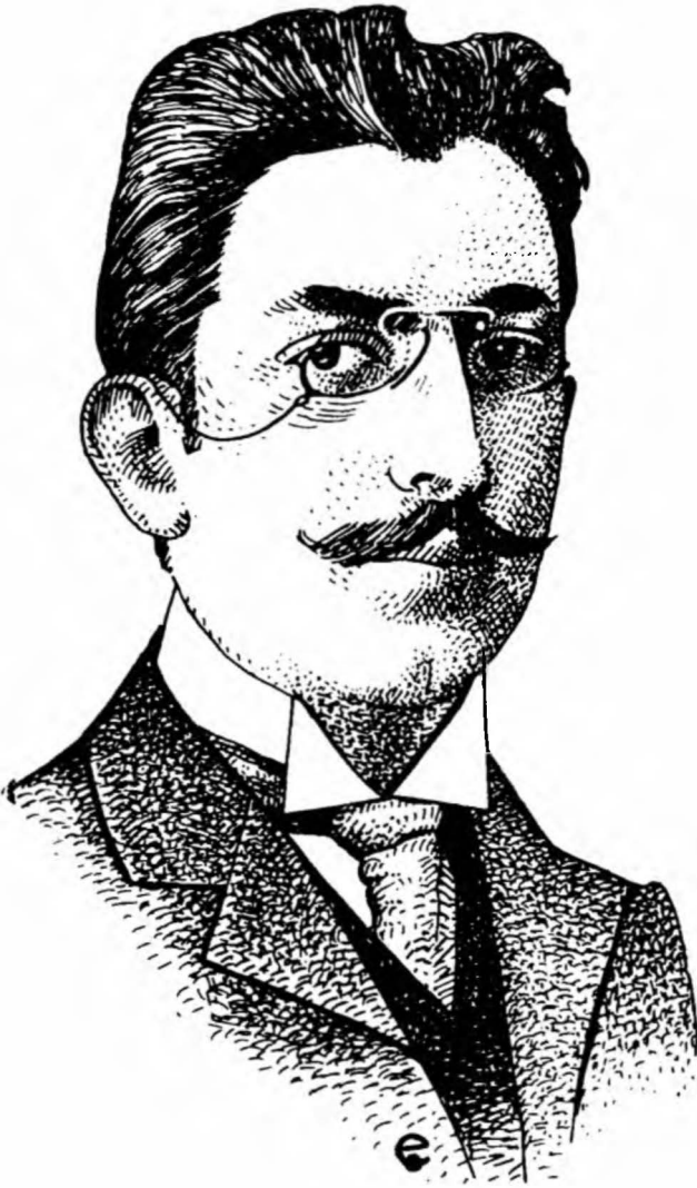
Öldürülen gazeteci Ahmet Samim Bey