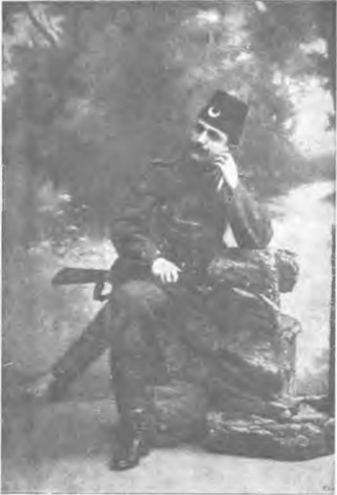
Hürriyet kahramanı Binbaşı Enver Bey (1908) Hürriyet kahramanı Enver Bey de kendini, ilk Meşrutiyet günlerinde hayallerine vermişti...