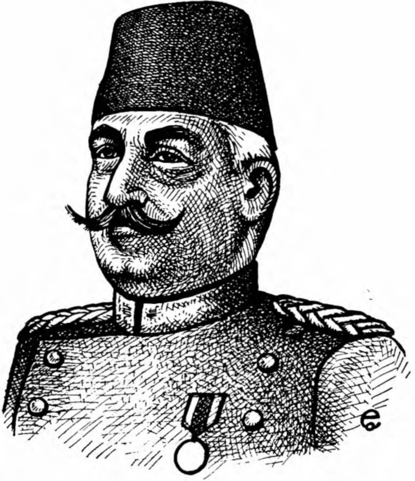
Harbiye Nazırs Nazım Paşa Ordusunu tanımayan bir başkomutan vekili