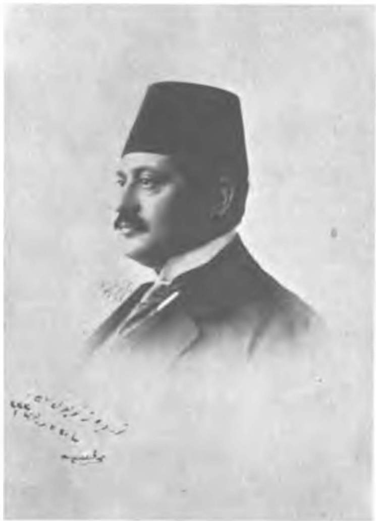
Dahiliye Nazırı Talat Paşa