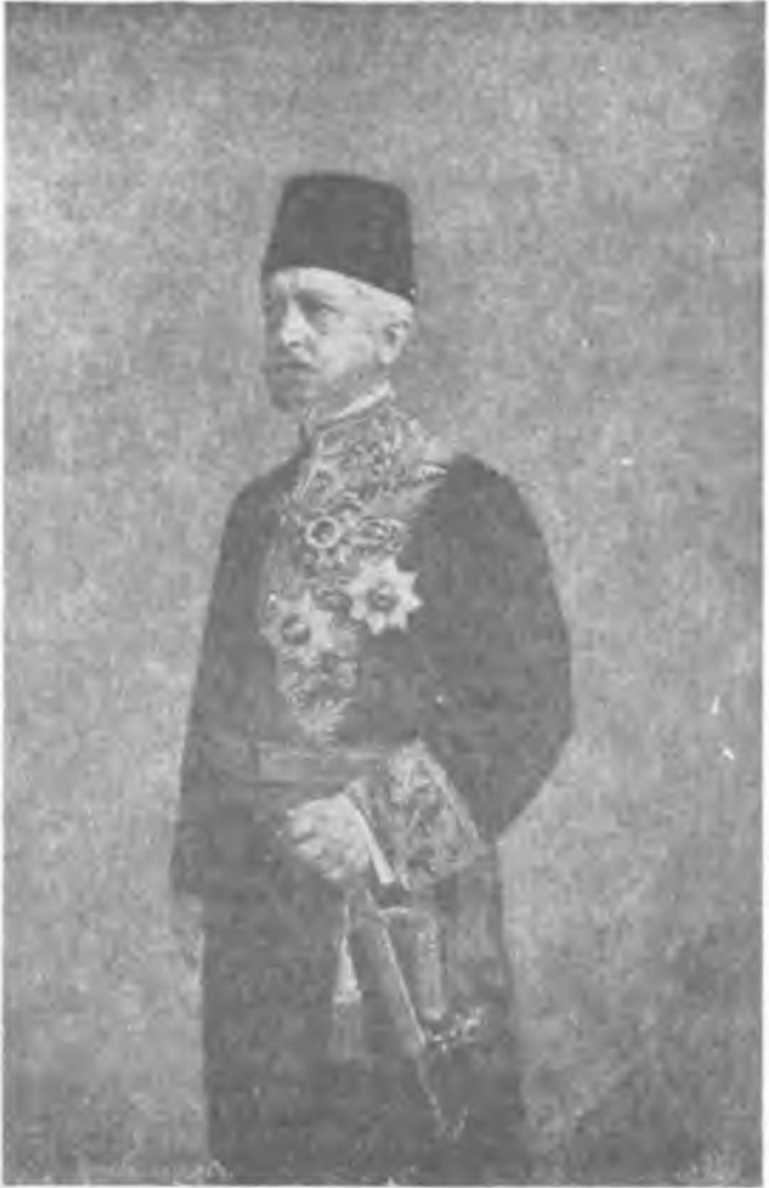
Mısırlı bir Sadrazam Prens Said Halim Paşa