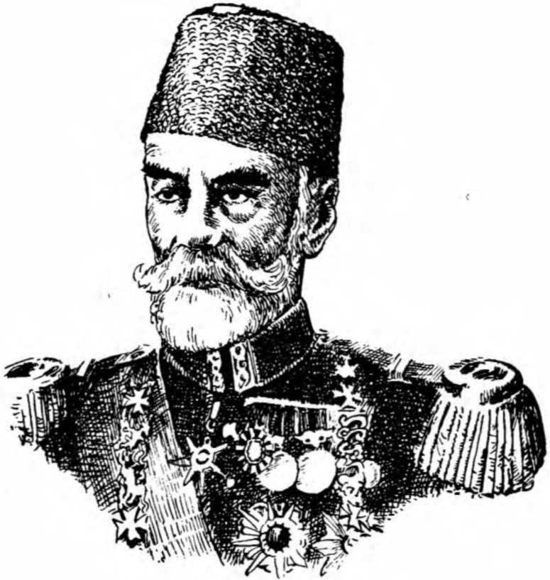
Gazi Ahmet Muhtar Paşa Yorgun kabinenin yorgun sadrazamı