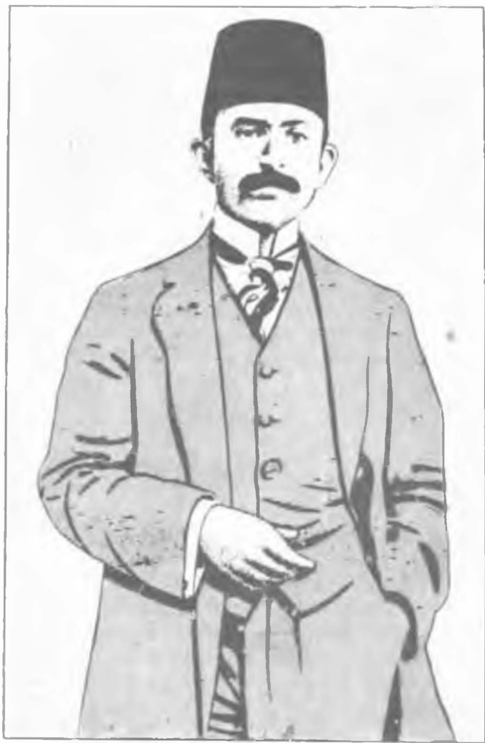
Maliye Nazırsı Cavit Bey