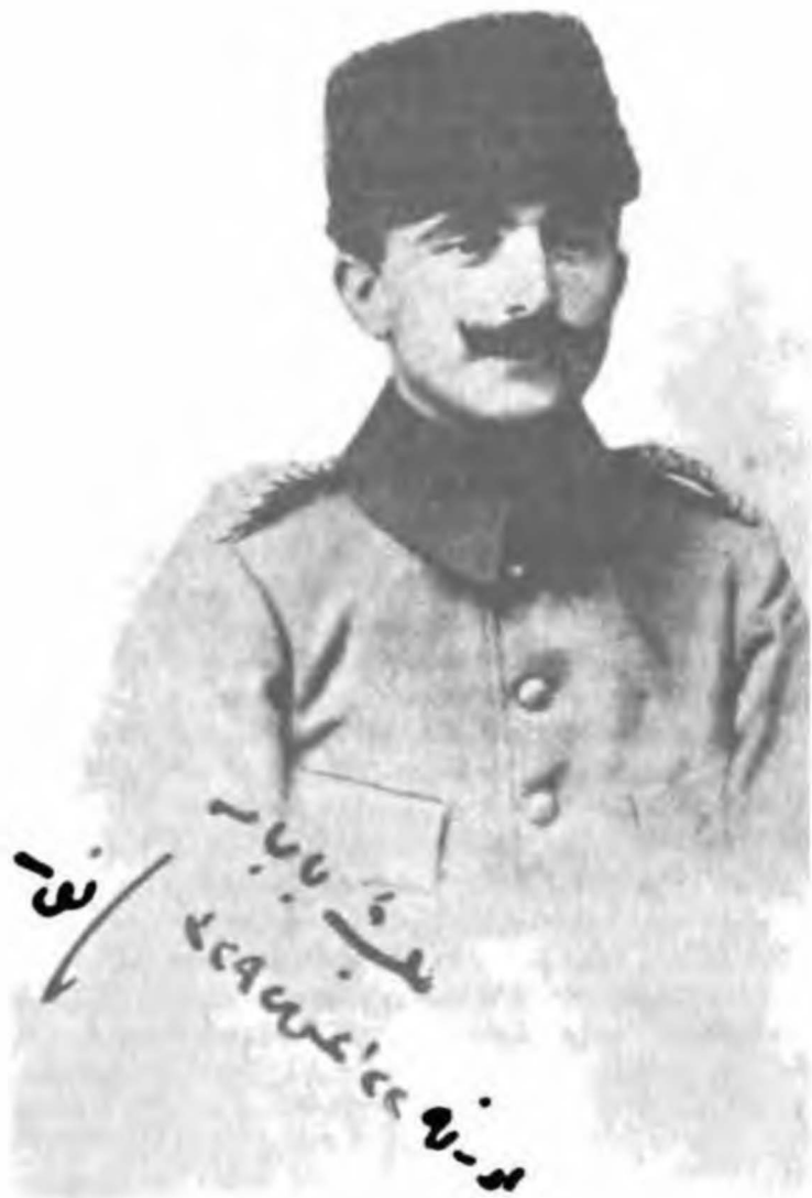
Enver Bey kurtarılan Edirne'de 22 Ağustos 1329 (5 Eylül 1913)