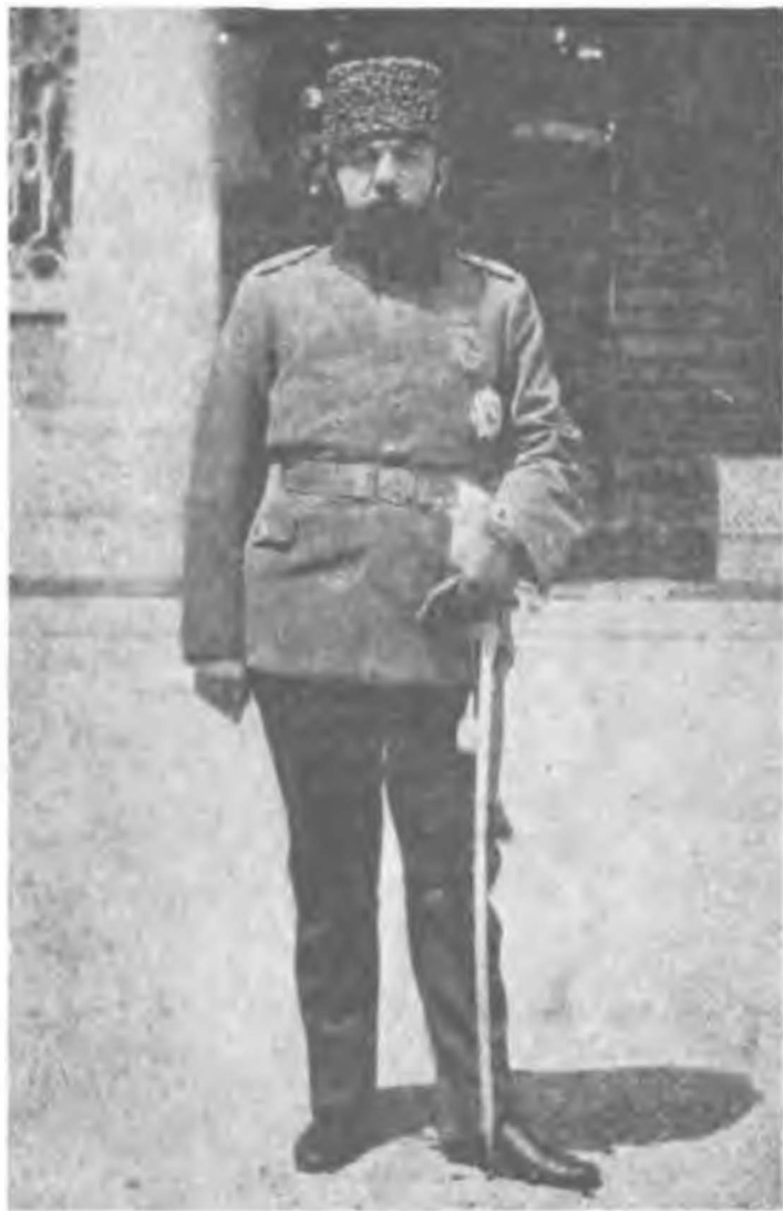
Babriye Nazırı Cemal Paşa