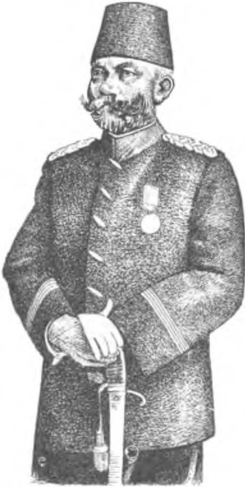
Harbiye Nazırı Ali Rıza Paşa

31 Mart ayaklanmasında isyancıların ve bilhassa medrese softalarının, en ziyade ele geçirmeye çalıştıkları ve öldürmek istedikleri, ordudan alaylı zabıtların temizlenmesine ve medreselere dolmuş olup, askerlikten kurtulan softaların askere alınmasına çalışan Ali Rıza Paşaydı. Medresede kalabilmek için basit bir imtibandan geçmek kararını savunuyordu. Halbuki softalar, dört hesap işleminden bile imtibana girmeye cesaret edemiyorlardı.