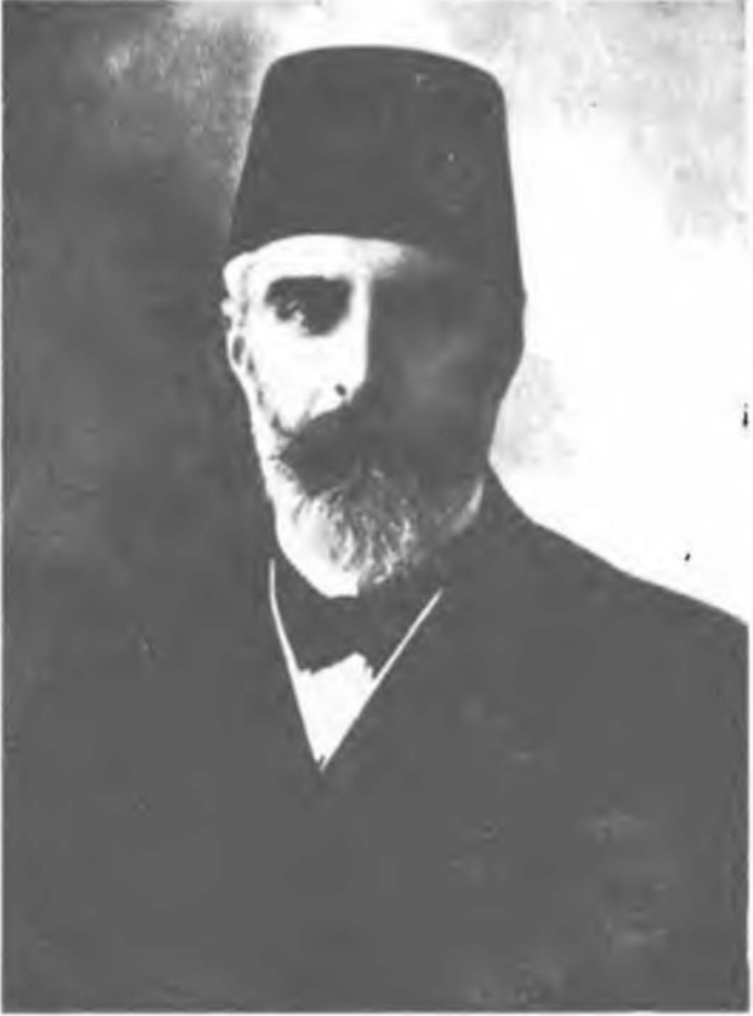
Abmet Rıza Bey İkinci Meşrutiyetin ilk Mebusan Meclisi Reisi