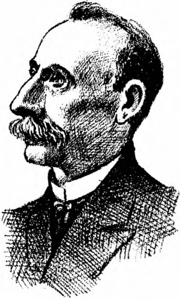
Rusya Trkleri arasında bir nc Ismail Bey Gaspirinski