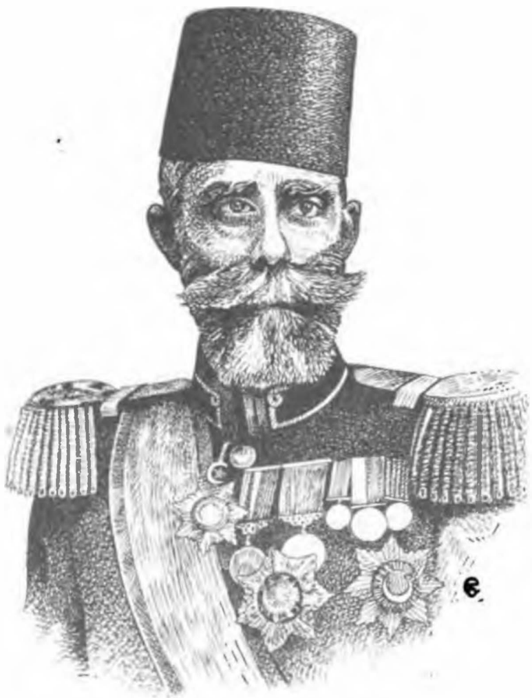
Mahmut Şevket Paşa