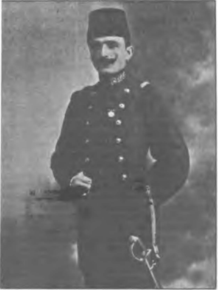
(Binbaşı) Enver Bey Hürriyet Kahramanı