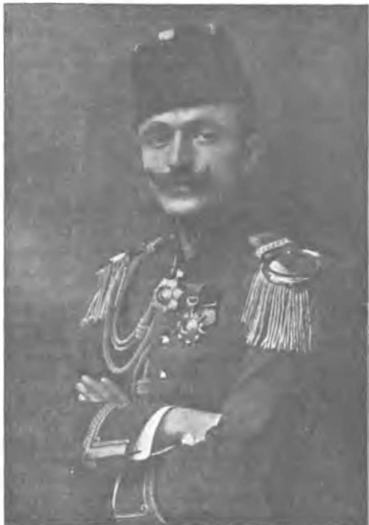
Enver Paşa Harbiye Nazırı