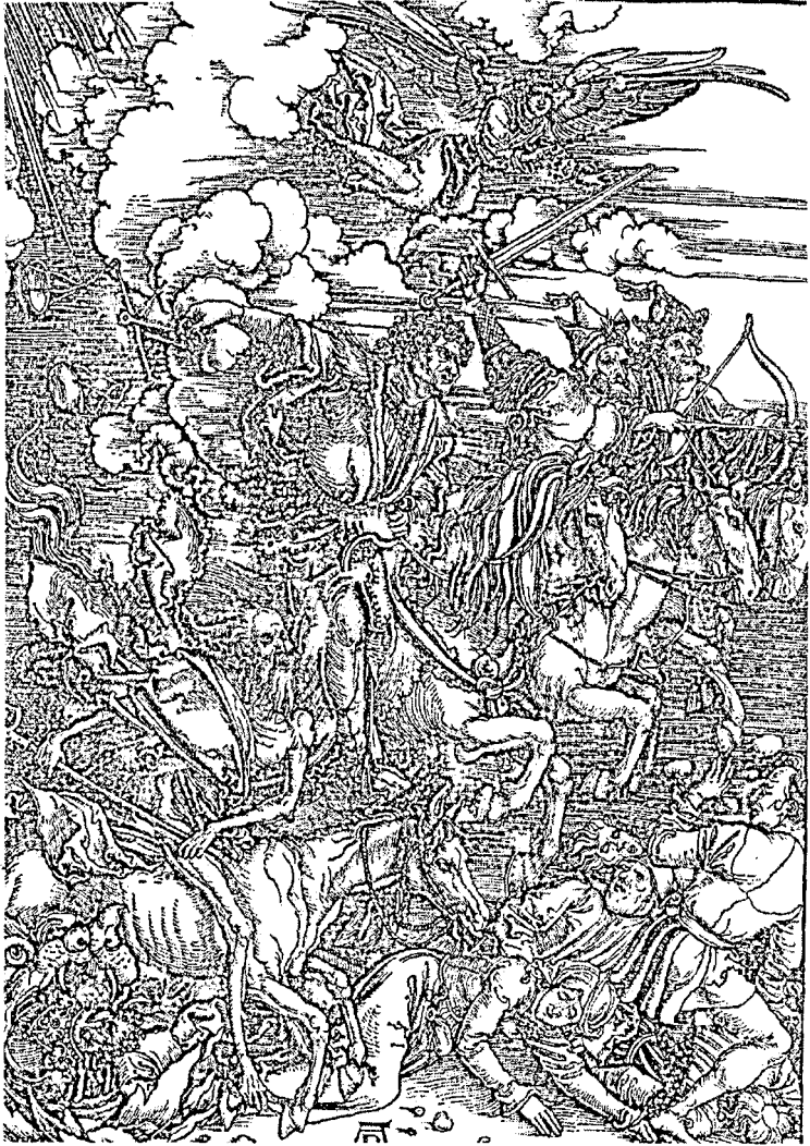
A.Durer'in Vahiy kitabı ekseninde çizdiği mahşerin dört atlısı